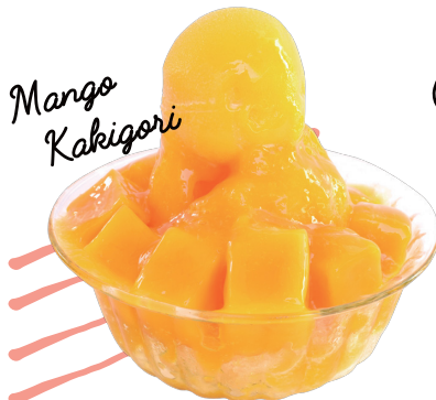
ទឹកកកឈូសសជាតិផ្លែស្វាយ