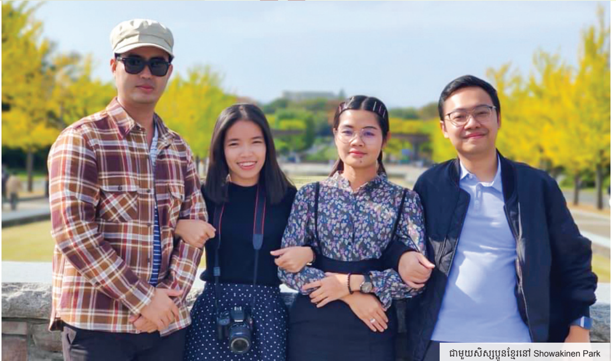
ជាមួយសិស្សប្អូនខ្មែរនៅ Showakinen Park

ផងដែរ។ នាងខ្ញុំក៏ធ្លាប់បានរៀនថ្នាក់ខ្លះជាមួយនិស្សិតជប៉ុនដែរ ឃើញថាពួកគាត់សុទ្ធតែមានចំណេះដឹងជ្រៅជ្រះ មានការវិភាគល្អ (critical thinking) ក៏ប៉ុន្តែពួកគាត់នៅមានភាពអៀនប្រៀនបន្តិច ចំពោះនិស្សិតបរទេស។