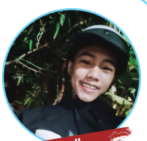
ជិះម៉ូតូ

ខ្ញុំជាមនុស្សដែលចូលចិត្តចេញក្រៅ ជួបអ្វីថ្មីៗ ជាធម្មតាយើងជិះម៉ូតូស្រួលនៅពេលដែលគ្មានភ្លៀង ហើយយើងលំបាកមែនទែននៅពេលជិះម៉ូតូនៅពេលភ្លៀង ដូចនេះខ្ញុំចូលចិត្តធ្វើរឿងលំបាក គឺជិះម៉ូតូហាលភ្លៀង ហើយបើសិនជាអាចខ្ញុំចូលចិត្តហៅមិត្តភក្តិជួបជុំ ទៅចាប់ក្តាមផងដែរ។