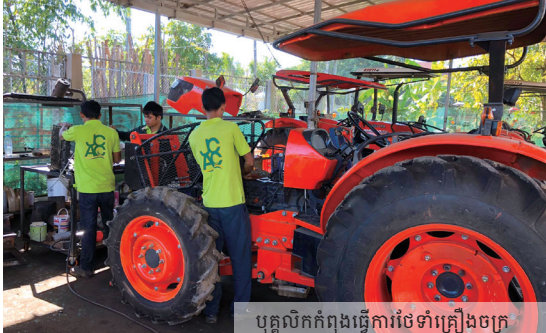
បុគ្គលិកកំពុងធ្វើការចំពោះគ្រឿងចក្រ

បច្ចុប្បន្ន ក្រុមហ៊ុនសម្រេចបានមួយផ្នែកនៃការផ្ទេរនូវប្រព័ន្ធមួយចំនួនរបស់សមាគមកសិកម្មជប៉ុនល្អៗ តាមរយៈការផ្គត់ផ្គង់នូវផ្នែកសម្ភារៈដូចជា “ម៉ាស៊ីននិងបច្ចេកទេសកសិកម្មដូចជាសម្ភារៈ” និងផ្នែកចំណេះដឹង។ នៅថ្ងៃអនាគត ក្រុមហ៊ុននឹងធ្វើអោយសម្រេចបាននូវតួនាទីមួយយ៉ាងសំខាន់ដូចសមាគមកសិកម្មជប៉ុន ក្នុងការ “ទិញកសិផលពីកសិករដោយតម្លៃសមរម្យនិងទៀងទាត់”។