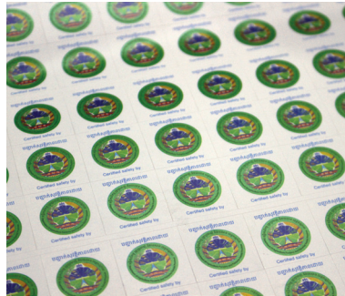
ស្លាកសញ្ញារបស់មជ្ឈមណ្ឌល