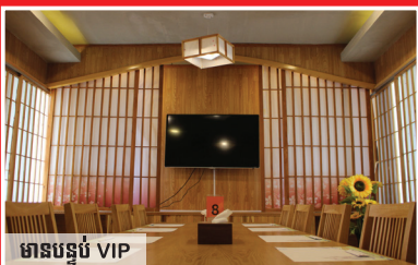
មានបន្ទប់ VIP