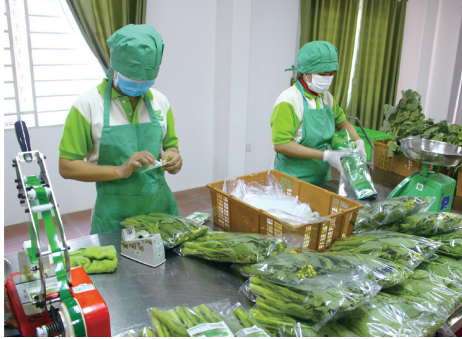
ការវេចខ្ចប់បន្លែដែលត្រូវបានត្រួតពិនិត្យហើយបិទស្លាកសញ្ញា

នៅក្នុងមន្ទីរក៏មានបិតស្លាកសញ្ញាធានាគុណភាពបន្ទាប់ពីការត្រួតពិនិត្យ និងមានបន្ទប់ធម្មតានិងបន្ទប់ត្រាសេត្រជាក់ ដើម្បីរក្សាទុកបន្លែនិងផ្លែឈើ ដែលបានពិនិត្យគុណភាពហើយផងដែរ។ បច្ចុប្បន្ន ដោយសារមានអតិថិជនជាច្រើនទាមទារអោយមានការត្រួតពិនិត្យគុណភាពកសិផល ហើយភាពចាំបាច់នៃការត្រួតពិនិត្យកសិផលត្រូវបានទទួលស្គាល់ដែរនោះ ទើបក្រសួងកសិកម្ម រុក្ខាប្រមាញ់និងនេសាទ បានជម្រុញអោយកសិករយកកសិផលរបស់ខ្លួនមកពិនិត្យគុណភាពនៅមជ្ឈមណ្ឌលនេះ មុនដាក់លក់