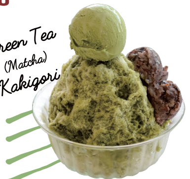
ទឹកកកឈូសសជាតិតៃបៃតង (Matcha)

★ យើងក៏មានមីឌុយផ្សេងទៀតផងដែរដូចជា ទឹកផ្លែឈើ និងទឹកផ្លែឈើក្រឡុកស្រស់ៗ, កាហ្វេ, សាំងរិប ។ ល។ ★