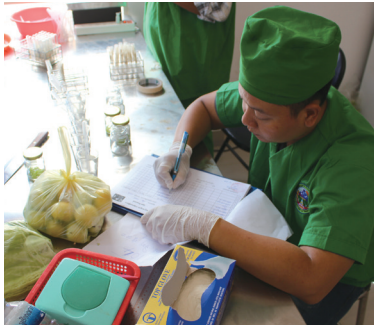
ការត្រួតពិនិត្យគុណភាពបន្លែនៅមជ្ឈមណ្ឌល

មជ្ឈមណ្ឌលប្រមូលផ្តុំ ពិនិត្យគុណភាពនិងចែកចាយបន្លែឧត្តកណ្តាល បានបង្កើតអោយមានព្រឹត្តិការណ៍នានានៅមូលដ្ឋាន ក៏ដូចជាការចូលរួមក្នុងកម្មវិធីលក់បញ្ជុះតម្លៃនៅតាមផ្សារទំនើប និងបង្កើតអោយមានកម្មវិធីអប់រំកសិករជាដើម ដើម្បីអោយកសិកររស់នៅក្នុងមូលដ្ឋាន និងក្រុមហ៊ុនផ្គត់ផ្គង់កសិផលទៅទីផ្សារ ព្រមទាំងអតិថិជនបានដឹងនិងស្គាល់ពីមជ្ឈមណ្ឌលនេះ ក្នុងគោលបំណងជួញដូរអំពីភាពចាំបាច់នៃការពិនិត្យគុណភាព ដែលធានានូវសុវត្ថិភាពមូលហេតុជូនអតិថិជន។