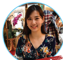
ចូលចិត្តទៅលេងខាងក្រៅ

នៅរដូវមានភ្ញៀវ (ហើយគ្មានជំងឺរាតត្បាត កូរ៉ូណា!) ខ្ញុំចូលចិត្តទៅលេងនៅខាងក្រៅ ដូចជា នៅកន្លែងចិញ្ចឹមត្រី ទៅមើលកុន និងទៅហាងកាហ្វេជាមួយមិត្តភក្តិជាដើម។