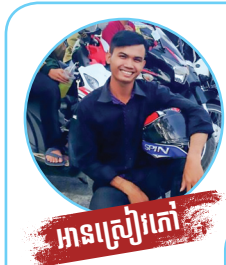
អានសៀវភៅ

មេឃចាប់ផ្តើមធ្លាក់ភ្លៀងនៅក្នុងខែឧសភារហូតដល់ខែតុលា ដែលជាពេលខ្យល់ មូស្យុង បក់ពីទិសនិរតី ។ នៅក្នុងអំឡុងពេលខែនេះ មនុស្សម្នាពិតជាសប្បាយចិត្តណាស់ ជាពិសេសសំរាប់កសិករវិញ ប្រញាប់ប្រញាល់ធ្វើកសិកម្ម ព្រោះដំណាំកសិកម្មត្រូវការទឹកជាចាំបាច់។ តែមិនមែនតែកសិករនៅឯស្រែទេដែលសប្បាយចិត្ត ក្រៅពីនោះប្រជាជននៅទីក្រុងក៏សប្បាយចិត្តដែរទៅតាមទំលាប់ប្រជាជនកម្ពុជា។ ចំពោះប្រជាជនជប៉ុនវិញក៏មានវប្បធម៌មួយបែបដែរនៅក្នុងរដូវដែលមានភ្លៀងធ្លាក់។ ចង់ដឹងថាមានអ្វីខុសគ្នាពី ជនជាតិខ្មែរ និងជនជាតិជប៉ុន តោះអានអត្ថបទខាងក្រោម!