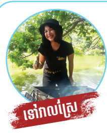
នៅវាលស្រែ

នៅក្នុងរដូវភ្លៀង បើខ្ញុំនៅផ្ទះស្រុក ខ្ញុំចូលចិត្តចេញក្រៅលេងទឹកភ្លៀង ទៅស្រែចាប់ត្រី ចាប់ក្តាម ខ្យង ហើយជិះកង់តាមភ្លឺស្រែ ជាមួយបងប្អូន តែពេលខ្លះខ្ញុំក៏នៅផ្ទះ ធ្វើសម្លរក្តៅៗស្រុកស្រែ ញ៉ាំជាមួយបាយសមើលទូរទស្សន៍ ជុំគ្រួសារ។ តែពេលខ្ញុំមកនៅទីក្រុង ខ្ញុំតែងចំណាយពេលរៀនធ្វើម្ហូប និងគេងស្តាប់សំលេងទឹកភ្លៀង វាធ្វើអោយខ្ញុំមានអារម្មណ៍ថាការគេងរបស់ខ្ញុំមានជាសុខភាព និងគេងលក់ស្រួល។