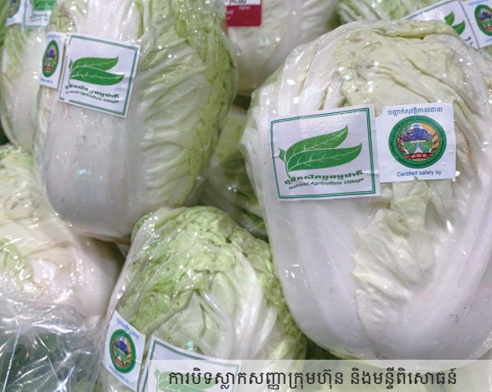
ការបិទស្លាកសញ្ញាក្រុមហ៊ុន និងមន្ទីរពិសោធន៍