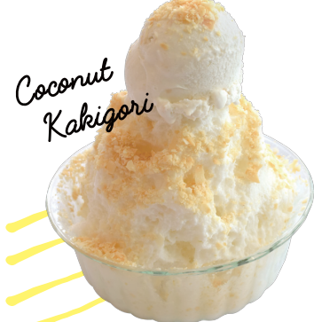
ទឹកកកឈូសសជាតិដូង