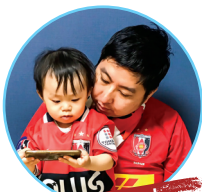
មើលកីឡាបាល់ទាត់

ចូលចិត្តមើលកីឡាបាល់ទាត់តាមអ៊ីនធឺណេត ជាមួយកូននៅផ្ទះក្នុងថ្ងៃមានភ្ញៀវ។