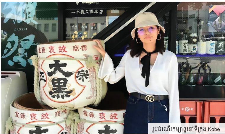
រូបដំណើរកម្សាន្តនៅទីក្រុង Kobe

នាងខ្ញុំសង្ឃឹមថាការស្រាវជ្រាវរបស់នាងខ្ញុំ អាចផ្តល់ជាការ ចែករំលែកមួយសម្រាប់ថ្នាក់ដឹកនាំគ្រប់ជាន់ថ្នាក់ ដើម្បីស្វែងយល់ បន្ថែមនិងជ្រើសរើសភារកិច្ចបទដ៏ត្រឹមត្រូវ សម្រាប់ដឹកនាំមន្ត្រី រាជការអោយបំពេញការងារបានពេញលេញនិងអស់ពីសមត្ថភាព ក្នុងគោលបំណងកាត់បន្ថយការទិញចំពោះបុគ្គលិករដ្ឋពី សំណាក់ប្រជាពលរដ្ឋ។ ជាពិសេស នាងខ្ញុំសង្ឃឹមថា ការស្រាវជ្រាវ នេះអាចជាការរួមចំណែកមួយ សម្រាប់ជួយបន្ថែមនូវគុណភាព ក្នុងការផ្តល់សេវាសាធារណៈ ដល់ប្រជាពលរដ្ឋអោយបានកាន់ តែល្អប្រសើរ។ ជាចុងបញ្ចប់ នាងខ្ញុំសំណូមពរអោយបងប្អូន សិស្សនិស្សិតយើងនៅប្រទេសកម្ពុជាទាំងអស់ ខិតខំប្រឹងប្រែងរៀនសូត្រ និងអានសៀវភៅ អោយបានច្រើន។ និស្សិតខ្មែរគួរតែព្យាយាម សាកល្បងស្វែងរកអាហារូបករណ៍ ហើយធ្វើ តេស្តសមត្ថភាពរបស់ខ្លួនដើម្បីចាប់យកឱកាស មកសិក្សានៅប្រទេសជប៉ុន ឬនៅប្រទេសរីក ចំរើនដទៃទៀត ក្នុងការអភិវឌ្ឍចំណេះដឹង បន្ថែម និងធ្វើអោយខ្លួនមើលឃើញពិភពលោក បានកាន់តែទូលំទូលាយ និងបង្កើតទំនាក់ទំនង ច្រើន ព្រមទាំងមានការស្រលាញ់ជាតិខ្លួន កាន់តែខ្លាំង។