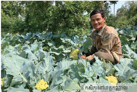
កសិករនៅខេត្តកណ្តាល

ខ្ញុំបានបំរើការនៅក្នុងក្រុមហ៊ុនភូមិកសិកម្មធម្មជាតិនេះជាង ២ ឆ្នាំមកហើយ ឥឡូវនេះយើងខ្ញុំកំពុងខិតខំប្រឹងប្រែងធ្វើការផ្សព្វផ្សាយអំពីវិធីសាស្ត្រដាំដុះ ដែលផ្អែកលើស្តង់ដារសុវត្ថិភាពដែលមានឈ្មោះថា CamGAP កំណត់ដោយអគ្គនាយកដ្ឋានកសិកម្មនៃក្រសួងកសិកម្ម រុក្ខាប្រមាញ់ និងនេសាទ ហើយចូលរួមអនុវត្តតាមដានត្រួតពិនិត្យគុណភាពដោយ មន្ទីរកសិកម្ម រុក្ខាប្រមាញ់ និងនេសាទខេត្តកណ្តាល និងក្រុមហ៊ុន យ៉ាងម៉ត់ចត់អំពីការគ្រប់គ្រងគុណភាពកសិផល តាំងពីចំនុចចាប់ផ្តើមការដាំដុះ រហូតដល់យកទៅលក់ជូនអតិថិជននៅទីផ្សារ។