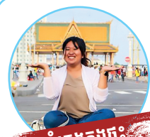
សម្លឹងគេងក្នុងផ្ទះ

ពេលភ្លៀងម្តងៗ ខ្ញុំមិនចូលចិត្តចេញក្រៅទេ ខ្ញុំតែងតែសម្លឹងគេងក្នុងផ្ទះ ព្រោះខ្ញុំខ្លាចភ្លៀង ហើយមានខ្យល់ខ្លាំងៗ។