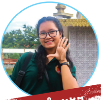
ដាំដំណាំផ្សេងៗ ឬនៅស្រែ

ក្នុងខែភ្លៀង ខ្ញុំចូលចិត្តដាំដំណាំផ្សេងៗ ទៅស្រែទៅមើលទឹកភ្លៀងថាវាលិចស្រែឬអត់ បើទឹកច្រើនពេក ខ្ញុំបង្ហូរវាចេញខ្លះ ព្រោះខ្លាចដំណាំស្រូវមានការខូតខាត។ ហើយមួយទៀត ខ្ញុំចូលចិត្តគេងស្តាប់ទឹកភ្លៀង ព្រោះវាធ្វើអោយមានអារម្មណ៍ល្អៗ ដែលមិនអាចបំភ្លេចបាន ជាមួយគូរស្នេហារបស់ខ្ញុំ និងគេងលក់ស្រួលផងដែរ។