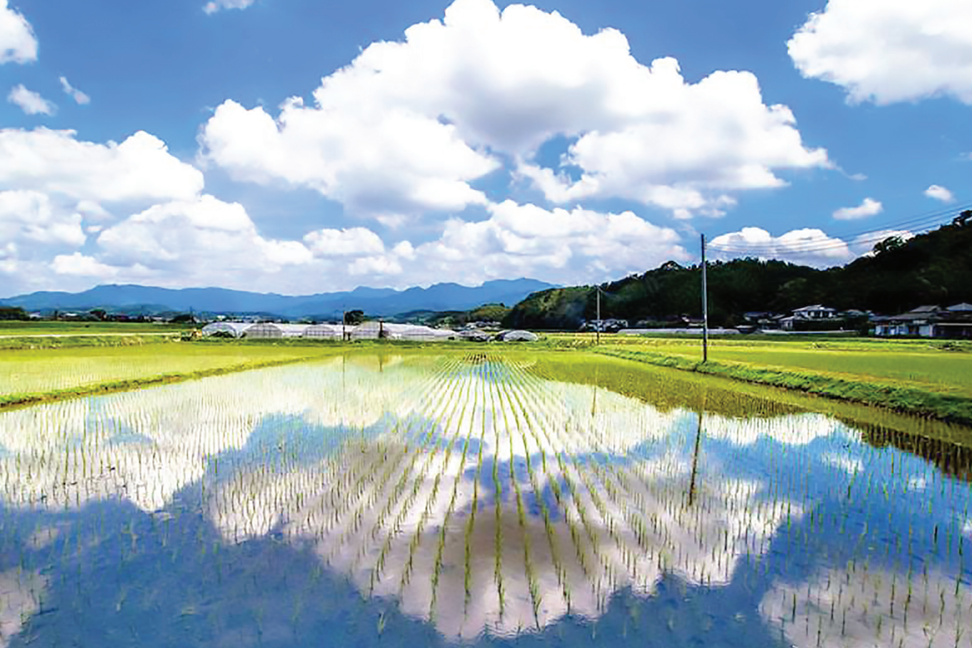
Created by modifying <Paddy fields Kumamoto>(©< Kikuchi City >,Creative Commons Attribution 4.0 International License. (CC BY 4.0) )